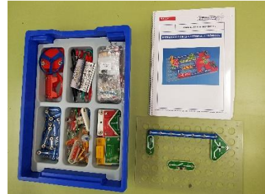
Prácticas de Electrónica